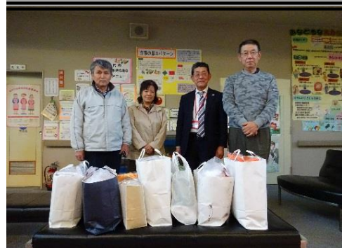
<茨城県退職公務員連盟 結城郡支部の皆さん>