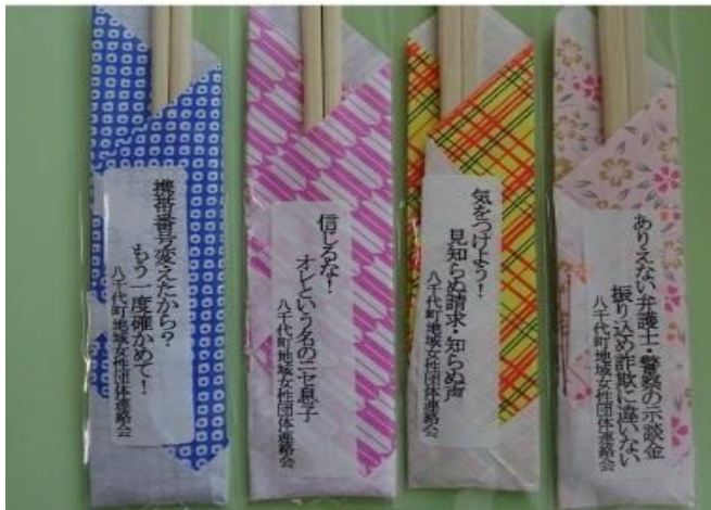
高齢者を狙った詐欺被害に気をつけるように注意を呼びかけました

「ひとり暮らし高齢者の友愛訪問事業に役立ててください。」と割り箸の寄付があり、対象者94名の方にお弁当と一緒にお届けしました。割り箸には、高齢者を狙った詐欺被害を未然に防げるように、注意の呼びかけが書いてあり、気をつけてもらうよう啓発しました。また、絵手紙ボランティアによる絵も添えてお届けしました。