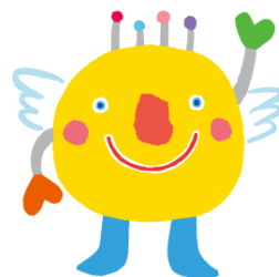
愛称:いばラッキー