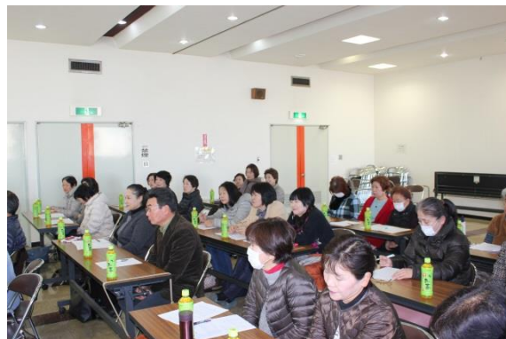
多くのボランティアに参加いただきました