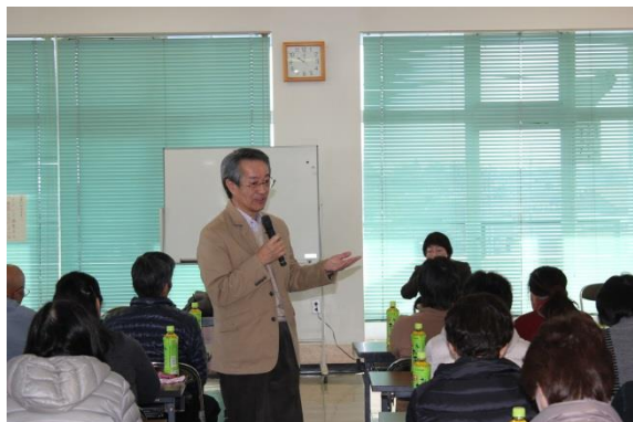
聴き方について学びました

また、平成28年度の友愛訪問事業についても打合せ会を行い、事業計画や検討事項について話し合われました。