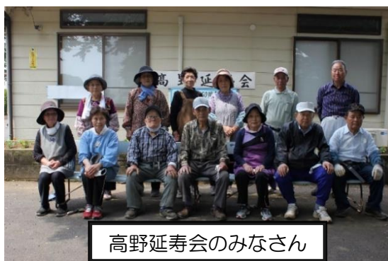
高野延寿会のみなさん